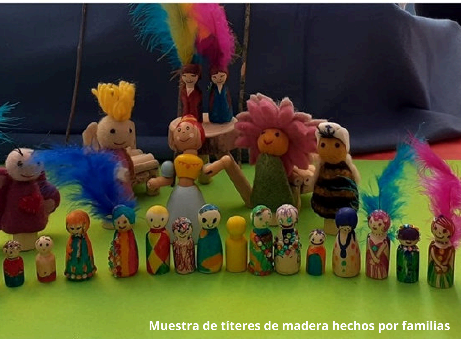
Muestra de títeres de madera hechos por familias